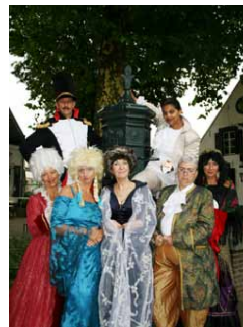
Op verschillende locaties kunt u genieten van een optreden van theatergroep Splinter.

Met vragen over de Open Monumentendag belt u met de heer O. Wttewaall, via telefoon (030) 63 92 611.