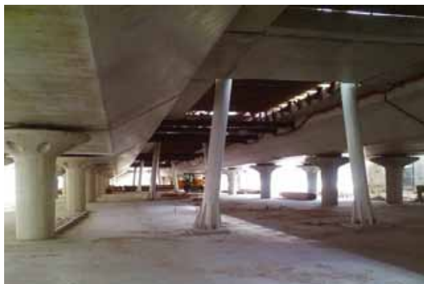
Er wordt hard gewerkt aan het nieuwe fietstransferium onder het spoor

nieuwe fietsenstalling. Vanaf 30 augustus worden de klemmen aan de westkant van het spoor verplaatst. De gemeente verzoekt fietsers hun fiets vanaf 23 augustus niet meer in het Onderdoor oost te stallen en vanaf 30 augustus niet meer aan de westkant van het spoor. Voor de aannemer zijn de werkzaamheden een logistieke puzzel, uw medewerking draagt bij aan de oplossing!